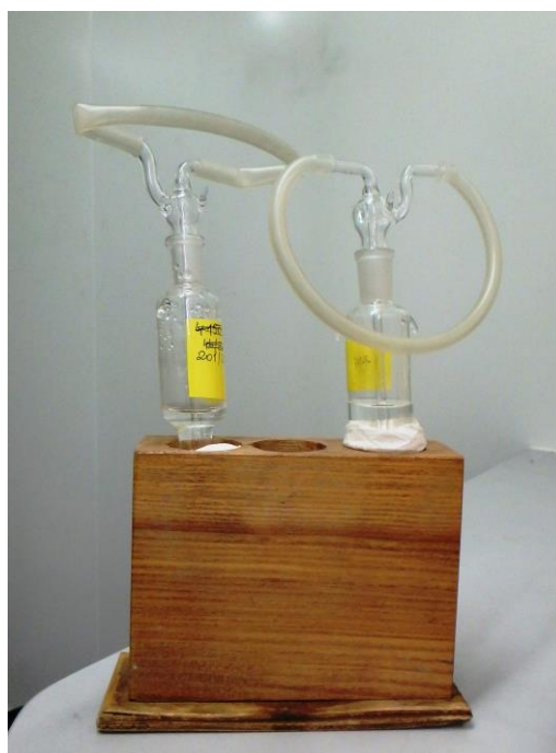
Płuczka z płynem pochłaniającym do badań stężenia formaldehydu w powietrzu

Formaldehyd jest obecny w atmosferze jako składnik zanieczyszczeń, niekiedy o dużych stężeniach (do 0,197 \text{ mg/m}^3 ), zwłaszcza w rejonach uprzemysłowionych i zurbanizowanych. Oprócz przemysłowych technologii wytwarzania i przetwórstwa formaldehydu, głównym źródłem emitowanego do atmosfery formaldehydu są procesy spalania paliw energetycznych (stałych, płynnych i gazowych) w zakładach energetycznych, elektrociepłowniczych i kotłowniach, spalania paliw pędnych w silnikach samochodowych oraz spalania odpadów komunalnych w spalarniach. Ponadto formaldehyd tworzy się na drodze naturalnej fotooksydacji węglowodorów aromatycznych pochodzących ze spalin samochodowych. Formaldehyd jest istotnym czynnikiem zanieczyszczającym powietrze w pomieszczeniach mieszkalnych i biurowych. Źródłem emisji tego związku są płyty wiórowe, paździerzowe i pilśniowe stosowane w elementach konstrukcyjnych, wykończeniowych i wyrobach meblarskich oraz lakiery, farby, kleje, niektóre rodzaje tapet i wykładzin podłogowych, materiały izolacyjne z wełny mineralnej oraz upłynniacze do betonu użyte w procesie budowlanym. Formaldehyd jest także składnikiem dymu tytoniowego i ocenia się, że w 1 \text{ m}^3 dymu występuje 40 \text{ cm}^3 formaldehydu (Kupczewska-Dobeca M., 2008).