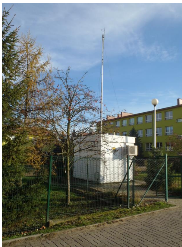
Stacja monitoringu powietrza w Żarach

Formaldehyd (wzór sumaryczny: HCHO, synonimy: aldehyd metylowy, aldehyd mrówkowy, metanal, oksometan, oksymetylen i tlenek metylenu) jest bezbarwnym gazem o specyficznym, ostrym, drażniącym zapachu. Klasyfikacja formaldehydu (zgodnie z rozporządzeniem ministra zdrowia z dnia 28 września 2005 r.): jest to substancja o możliwym działaniu rakotwórczym na człowieka, produkt toksyczny, żrący, działa toksycznie przez drogi oddechowe, w kontakcie ze skórą i po połknięciu; powoduje oparzenia, może powodować uczulenie w kontakcie ze skórą.