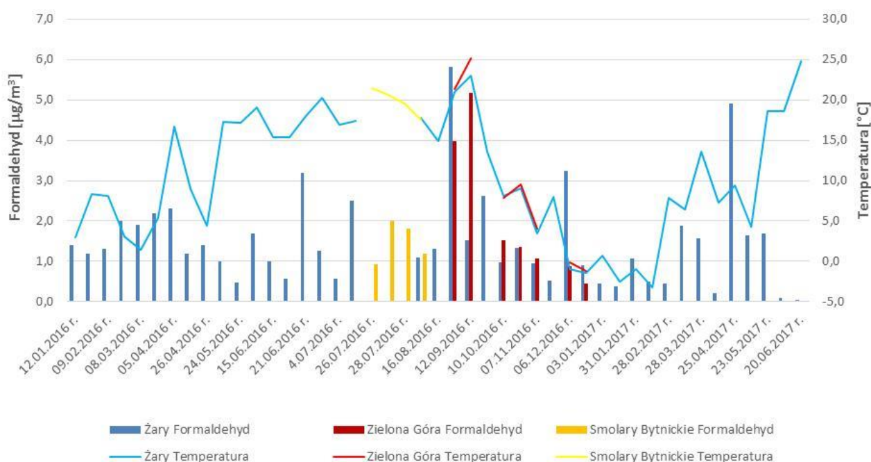
Rys. 3. Stężenia dobowe formaldehydu pomierzone w 2016 r. na stacjach: w Żarach, w Zielonej Górze oraz w Smolarach Bytnickich

Przeprowadzone badania na stacji w Smolarach Bytnickich zlokalizowanej na obszarze kompleksów leśnych Puszczy Rzepińskiej dają informację na temat stężenia tłowego tej substancji w środowisku, natomiast wyniki ze stacji w Zielonej Górze pokazują stężenia dla analogicznego obszaru zurbanizowanego. Analizując powyższe, stężenia średniodobowe ze Smolar Bytnickich zawierały się w przedziale od 0,9 do 2,0 \mu\text{g}/\text{m}^3 , przy czym wartość średnia